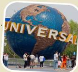
5 UNIVERSAL BEIJING