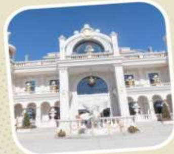
6 POP LAND