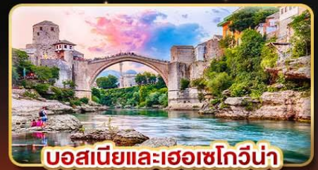
บอสเนียและเฮอร์เซโกวีนา