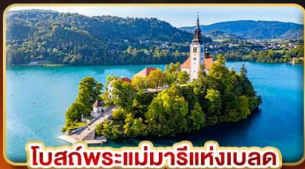
โบสถ์พระแม่มาเรียแห่งเบลด

เก็บทุกแลนด์มาร์ก เอเดรียติก ไข่มุกแห่งท้องทะเลยุโรปใต้