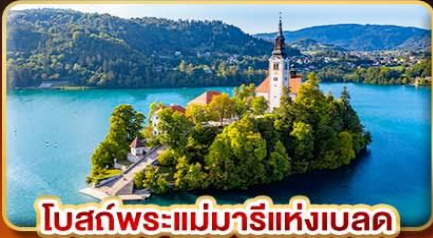
โบสถ์พระแม่มารีย์แห่งเบลด

เก็บทุกแลนด์มาร์ก เอเดรียติก ไข่มุกแห่งท้องทะเลยุโรปใต้