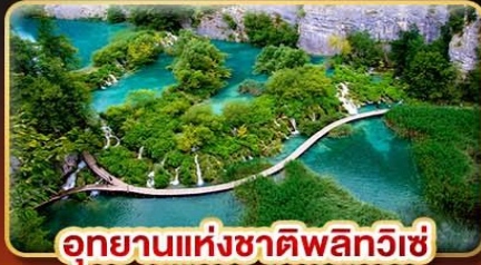
อุทยานแห่งชาติพลิวิเซ่