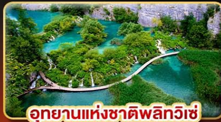
อุทยานแห่งชาติพลิวีเช