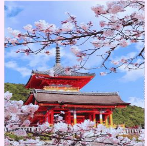
รูปถ่ายประกอบการเดินทางครั้งนี้