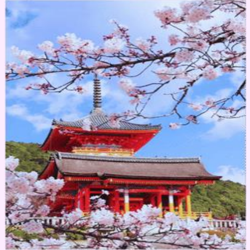
รูปถ่ายประกอบการเดินทางครั้งนี้