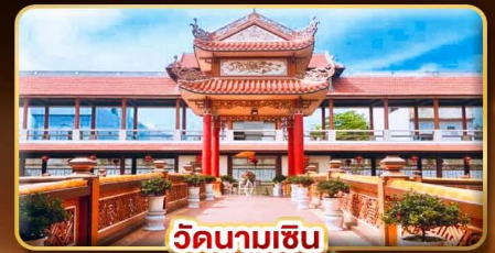
วัดนามเชิน