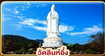
วัดลินห์ฮิ่ง