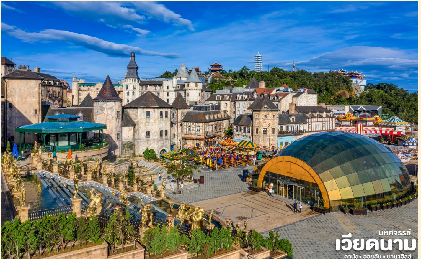
บัทจอร์รี่ เวียดนาม ดานัง • ฮอยอัน • บานาฮิลล์