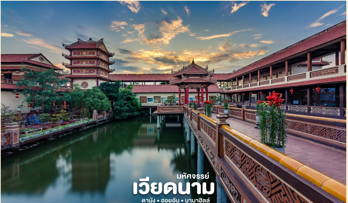
มหัศจรรย์ เวียดนาม ดานัง • ฮอยอัน • บานาวิล์ด

นำท่านชม วัดนามเซิน (Nam Son Pagoda) หรือ เจดีย์นัมเซิน ถูกสร้างขึ้นในปี 1962 เจดีย์นัมเซินมีรูปแบบสถาปัตยกรรมตามแบบฉบับของเวียดนามตอนกลางดั้งเดิม เจดีย์แบ่งออกเป็นหลายพื้นที่โดยมีลักษณะเฉพาะของตัวเอง ได้แก่ ทะเลสาบฟองชัน สะพานทามห่ง ศาลาวงเหียงนเหวียด อาคารเกสต์เฮาส์ ห้องโถงหลัก สะพานด่งทู เป็นต้น