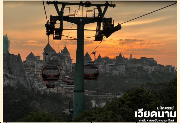
บัทจอร์รี่ เวียดนาม ดานัง • ฮอยอัน • บานาฮิลล์

นั่งกระเช้าขึ้นสู่บาน่าฮิลล์ กระเช้าแห่งบาน่าฮิลล์นี้ได้รับการบันทึกสถิติโลกโดย World Record ว่าเป็นกระเช้าไฟฟ้าที่ยาวที่สุด ประเภท Non Stop โดยไม่หยุดแะมีความยาวทั้งสิ้น 5,042 เมตร และเป็นกระเช้าที่สูงที่สุด 1,294 เมตร นักท่องเที่ยวจะได้สัมผัสปุยมะหมอกและบางจุดมีเมลล้อยต่ำกว่ากระเช้าพร้อมอากาศบริสุทธิ์อันสดชื่นจนทำให้ท่านอาจลืมไปเสียด้วยซ้ำว่าที่นี่ไม่ใช่ยุโรปเพราะอากาศที่หนาวเย็นเฉลี่ยตลอดทั้งปีประมาณ 10 องศาเท่านั้น