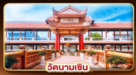
วัดนามเชิน