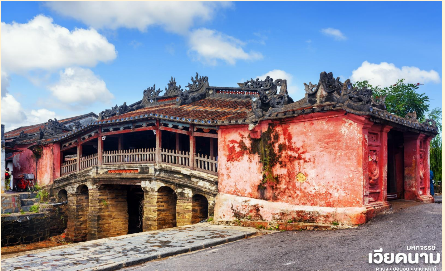
มหิศวรรษย์ เวียดนาม ดานัง • ฮอยอัน • ฮานอย

นำชม สะพานญี่ปุ่น ซึ่งสร้างโดยชุมชนชาวญี่ปุ่นเมื่อ 400 กว่าปีมาแล้ว กลางสะพานมีศาลเจ้าศักดิ์สิทธิ์ ที่สร้างขึ้นเพื่อสวดส่งวิญญาณมังกร ชาวญี่ปุ่นเชื่อว่ามี มังกรอยู่ใต้พิภพส่วนตัวอยู่ที่อินเดียและหางอยู่ที่ญี่ปุ่น ส่วนลำตัวอยู่ที่เวียดนาม เมื่อใดที่มังกรพลิกตัวจะเกิดน้ำท่วมหรือแผ่นดินไหว ชาวญี่ปุ่นจึงสร้างสะพานนี้โดยตอกเสาเข็มลงกลางลำตัวเพื่อกำจัดมันจะได้ไม่เกิดภัยพิบัติขึ้นอีก ชม ศาลกวนอู ซึ่งอยู่บนสะพาน ญี่ปุ่นและที่ฮอยอันชาวบ้านจะนำสินค้าต่าง ๆ ไว้ที่หน้าบ้าน เพื่อขายให้แก่นักท่องเที่ยวท่านสามารถซื้อของที่ระลึก เป็นของฝากกลับบ้านได้อีกด้วย เช่น กระเป๋าคอมไฟ เป็นต้น