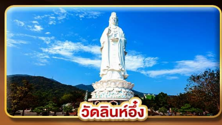
วัดลินห์ฮื่อง

"พิกบานาฮิลล์ 2 คืน" ไฟล์ทสวย "บินเช้ากลับตึก"