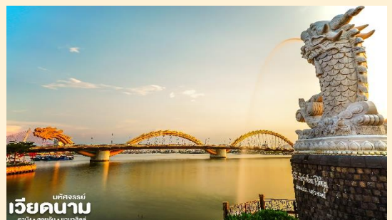
เวียดนาม นครโฮจิมินห์

จากนั้น นำท่านชม สะพานมังกร Dragon Bridge อีกหนึ่ง ที่เที่ยวดานังแห่งใหม่สะพานมังกรไฟสัญลักษณ์ ความสำเร็จแห่งใหม่ของเวียดนาม ที่มีความยาว 666 เมตร ความกว้างเท่าถนน 6 เลนส์ เชื่อมต่อสองฟากฝั่งของแม่น้ำฮันประเทศเวียดนามสะพานมังกรถูกสร้างขึ้นเพื่อเป็นแหล่งท่องเที่ยวดานัง เป็นสัญลักษณ์ของการฟื้นคืนประเทศ และเป็นการฟื้นฟูเศรษฐกิจของประเทศ โดยได้เปิดใช้งานตั้งแต่ปี 2013 ด้วยสถาปัตยกรรมที่บวกกับเทคโนโลยีสมัยใหม่ที่ได้รับแรงบันดาลใจจากตำนานของเวียดนามเมื่อกว่าหนึ่งพันปีมาแล้ว