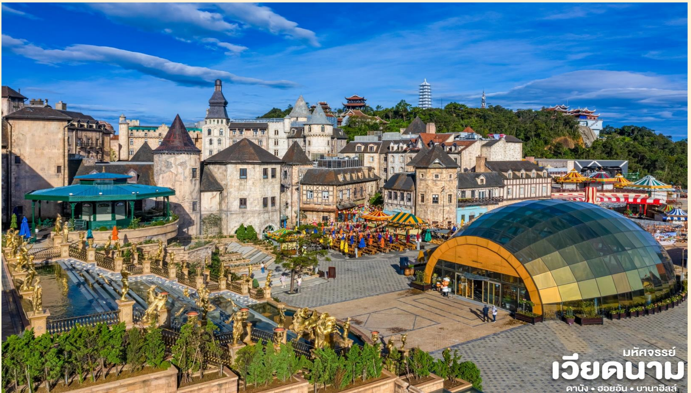
บัทจอร์จย์ เวียดนาม ดานัง • ฮอยอัน • บานาฮิลล์