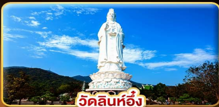
วัดลิ้นห้อย