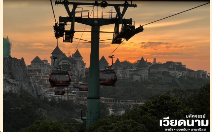
บัทจอร์จย์ เวียดนาม ดานัง • ฮอยอัน • บานาฮิลล์

นั่งกระเช้าขึ้นสู่บานาฮิลล์ กระเช้าแห่งบานาฮิลล์นี้ได้รับการบันทึกสถิติโลกโดย World Record ว่าเป็นกระเช้าไฟฟ้าที่ยาวที่สุด ประเภท Non Stop โดยไม่หยุดแะมีความยาวทั้งสิ้น 5,042 เมตร และเป็นกระเช้าที่สูงที่สุด 1,294 เมตร นักท่องเที่ยวจะได้สัมผัสปุยมะหมอกและบางจุดมีเมฆลอยต่ำกว่ากระเช้าพร้อมอากาศบริสุทธิ์อันสดชื่นจนทำให้ท่านอาจลืมไปเสียด้วยซ้ำว่าที่นี่ไม่ใช่ยุโรปเพราะอากาศที่หนาวเย็นเฉลี่ยตลอดทั้งปีประมาณ 10 องศาเท่านั้น