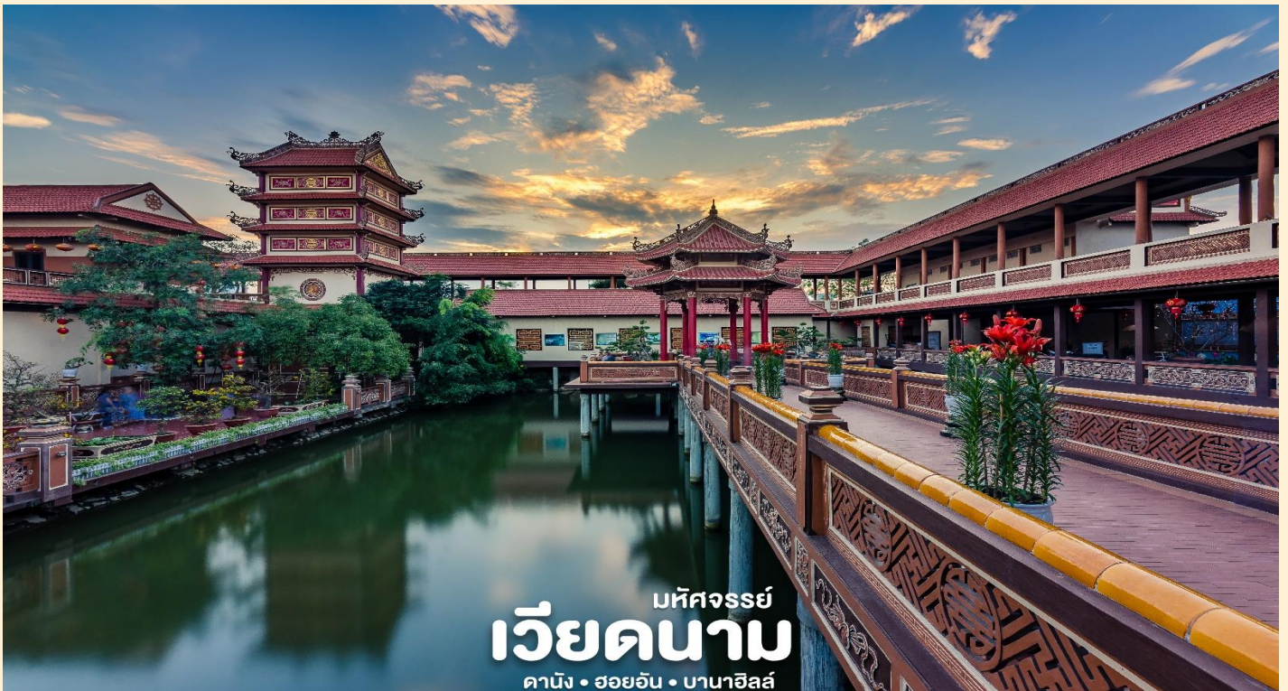
พิพิธภัณฑ์ เวียดนาม ดานัง • ฮอยอัน • บานาฮิลล์

นำท่านชม วัดนามเซิน (Nam Son Pagoda) หรือ เจดีย์นัมเซิน ถูกสร้างขึ้นในปี 1962 เจดีย์นัมเซินมีรูปแบบสถาปัตยกรรมตามแบบฉบับของเวียดนามตอนกลางดั้งเดิม เจดีย์แบ่งออกเป็นหลายพื้นที่โดยมีลักษณะเฉพาะของตัวเอง ได้แก่ ทะเลสาบฟองซัน สะพานทามทัง ศาลาวงแหงียน เหวียต อาคารเกสต์เฮาส์ ห้องโถงหลัก สะพานด่งทู เป็นต้น