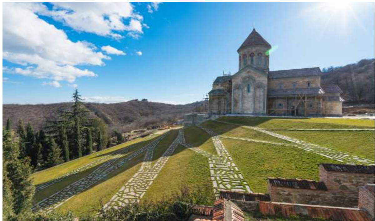
วิหารมากขึ้น วิหารแห่งนี้ได้ชื่อว่าวิหารที่เคยเป็นที่พำนักของร่างองค์เซนต์นินา ศาสดาหญิงผู้เป็นที่เลื่อมใสของชาว

บ่าย นำท่านชมสถานที่สำคัญ ของนิกายออร์ทอดอกซ์ Monastery of Saint Nina (วัดนักบุญนินา) ที่ ซิงนากี (Signagi) เป็นหนึ่งในสถานที่สำคัญทางศาสนาและประวัติศาสตร์ของจอร์เจีย ซึ่งมีบทบาทสำคัญในกระบวนการเผยแพร่ศาสนาคริสต์ไปยังประเทศจอร์เจียในศตวรรษที่ 4 วิหารโบราณ อดีตเคยใช้เป็นที่พักของนักแสวงบุญเลื่องชื่อของจอร์เจีย สร้างขึ้นราว ๆ ศตวรรษที่ 9 และมีการใช้ประโยชน์ยาวนานต่อเนื่อง ต่อมาในราว ๆ ศตวรรษที่ 17 ได้มีการต่อเติม