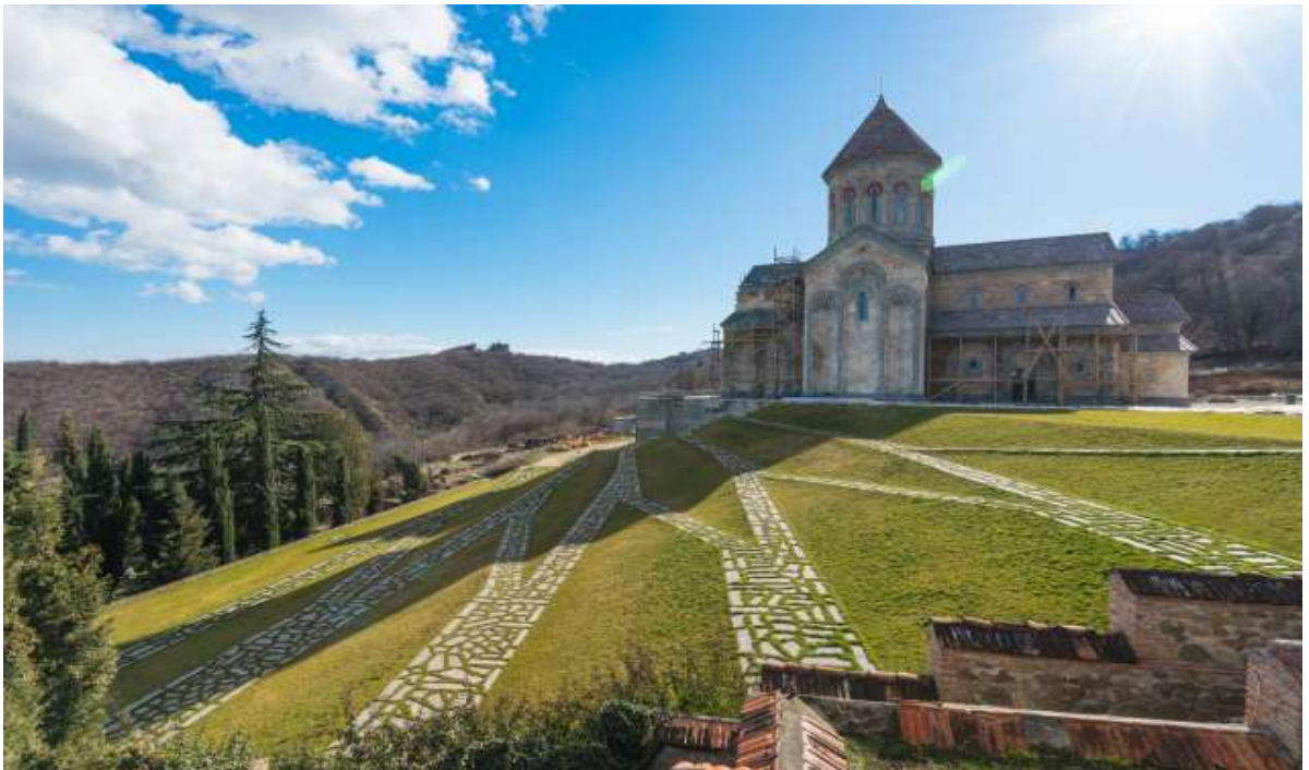
วิหารมากขึ้น วิหารแห่งนี้ได้ชื่อว่าวิหารที่เคยเป็นที่พำนักของร่างองค์เซนต์นินา ศาสตราหิงผู้เป็นที่เลื่อมใสของชาว

บ่าย นำท่านชมสถานที่สำคัญ ของนิกายออโรคอกซ์ Monastery of Saint Nina (วัดนักบุญนินา) ที่ ซิกนากิ (Signagi) เป็นหนึ่งในสถานที่สำคัญทางศาสนาและประวัติศาสตร์ของจอร์เจีย ซึ่งมีบทบาทสำคัญในกระบวนการเผยแพร่ศาสนาคริสต์ไปยังประเทศจอร์เจียในศตวรรษที่ 4 วิหารโบราณ อดีตเคยใช้เป็นที่พักของนักแสวงบุญเลื่องชื่อของจอร์เจีย สร้างขึ้นราว ๆ ศตวรรษที่ 9 และมีการใช้ประโยชน์ยาวนานต่อเนื่อง ต่อมาในราว ๆ ศตวรรษที่ 17 ได้มีการต่อเติม