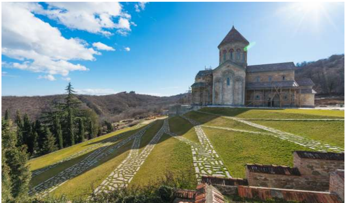
วิหารมากขึ้น วิหารแห่งนี้ได้ชื่อว่าวิหารที่เคยเป็นที่พำนักของร่างองค์เซนต์นินา ศาสดาหญิงผู้เป็นที่เลื่อมใสของชาว

บ่าย นำท่านชมสถานที่สำคัญ ของนิกายออร์ทอดอกซ์ Monastery of Saint Nina (วัดนักบุญนินา) ที่ ซิกนากี (Signagi) เป็นหนึ่งในสถานที่สำคัญทางศาสนาและประวัติศาสตร์ของจอร์เจีย ซึ่งมีบทบาทสำคัญในกระบวนการเผยแพร่ศาสนาคริสต์ไปยังประเทศจอร์เจียในศตวรรษที่ 4 วิหารโบราณ อดีตเคยใช้เป็นที่พักของนักแสวงบุญเลื่องชื่อของจอร์เจีย สร้างขึ้นราว ๆ ศตวรรษที่ 9 และมีการใช้ประโยชน์ยาวนานต่อเนื่อง ต่อมาในราว ๆ ศตวรรษที่ 17 ได้มีการต่อเติม