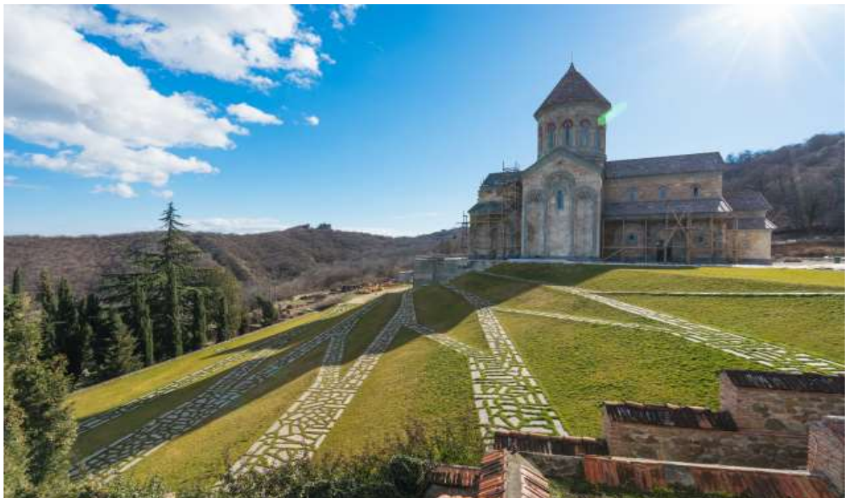
วิหารมากขึ้น วิหารแห่งนี้ได้ชื่อว่าวิหารที่เคยเป็นที่พำนักของร่างองค์เซนต์นินา ศาสดาหญิงผู้เป็นที่เลื่อมใสของชาว

บ่าย นำท่านชมสถานที่สำคัญ ของนิกายออร์ทอดอกซ์ Monastery of Saint Nina (วัดนักบุญนินา) ที่ ซิกนากิ (Signagi) เป็นหนึ่งในสถานที่สำคัญทางศาสนาและประวัติศาสตร์ของจอร์เจีย ซึ่งมีบทบาทสำคัญในกระบวนการเผยแพร่ศาสนาคริสต์ไปยังประเทศจอร์เจียในศตวรรษที่ 4 วิหารโบราณ อดีตเคยใช้เป็นที่พักของนักแสวงบุญเลื่องชื่อของจอร์เจีย สร้างขึ้นราว ๆ ศตวรรษที่ 9 และมีการใช้ประโยชน์ยาวนานต่อเนื่อง ต่อมาในราว ๆ ศตวรรษที่ 17 ได้มีการต่อเติม