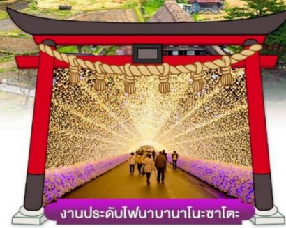
งานประดับไฟนาบานาโนะซาโตะ