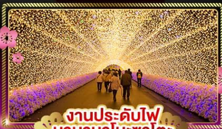
งานประดับไฟ นาคานาโนะซาโตะ