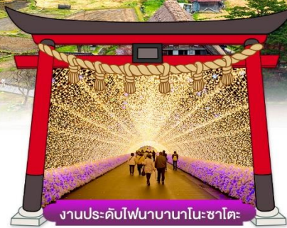
งานประดับไฟนาบานานาโนะซาโตะ