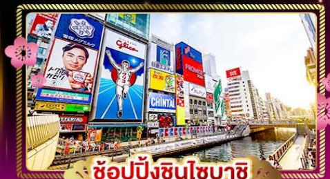
ช้อปปิ้งชินไซบาชิ