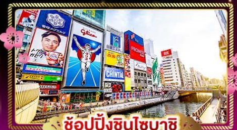
ช้อปปิ้งชินไซบาชิ