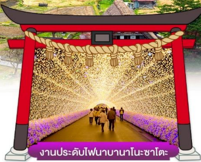
งานประดับไฟนาบานาโนะซาโตะ