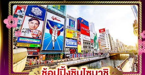
ช้อปปิ้งชินไซบาชิ