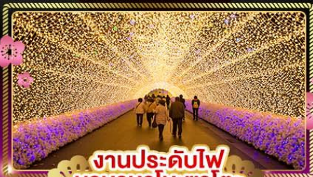
งานประดับไฟ นาคานาโนะซาโตะ