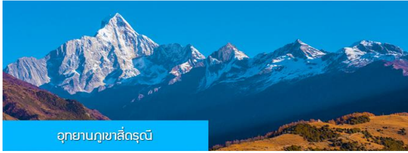
อุทยานภูเขาสี่ดรุณี