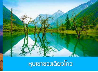
หุบเขาชวงเจียวโกว