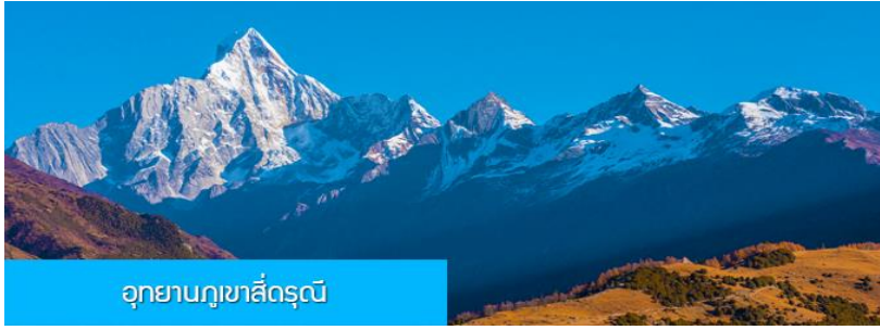
อุทยานภูเขาสี่ดรุณี