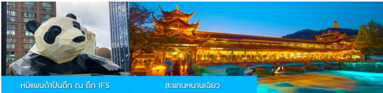
หมีแพนด้าปิ่นตึก ณ ตึก IFS

ระหว่างเดินทางท่านสามารถชมทัศนียภาพธรรมชาติอันงดงามของสองข้างถนนขณะที่รถแล่นผ่าน ที่มีทั้งภูเขาหิมะสูง หุบเขา ธารน้ำ และทุ่งหญ้าบนที่ราบสูง หรือพักผ่อนตามอัธยาศัยบนรถระหว่างเดินทาง