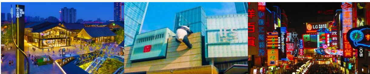
ถนนไท่กุ่หลี่ และวัดต้าเจ้อ