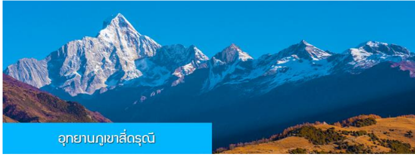
อุทยานภูเขาสี่ดรุณี