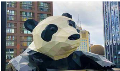
หมีแพนด้าปิ่นตึก ณ ตึก IFS

ระหว่างเดินทางท่านสามารถชมทัศนียภาพธรรมชาติอันงดงามของสองข้างถนนขณะที่รถแล่นผ่าน ที่มีทั้งภูเขาหิมะสูง หุบเขา ธารน้ำ และทุ่งหญ้าบนที่ราบสูง หรือพักผ่อนตามอัธยาศัยบนรถระหว่างเดินทาง