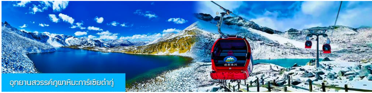
อุทยานสวรรค์ภูผาหิมะการ์เซียต้ากู่