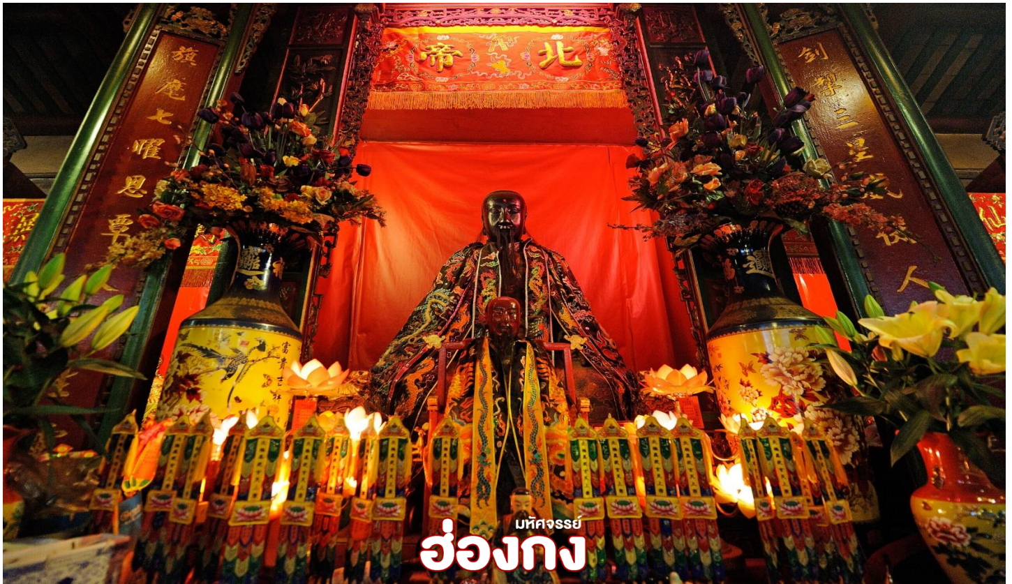
มัทศวงษย์ ฮองกง