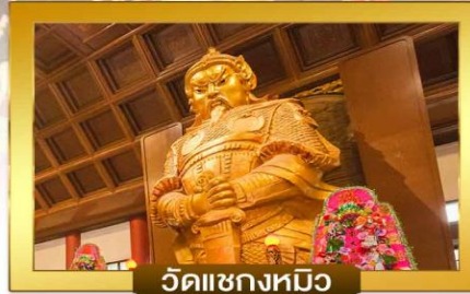
วัดแซงหมิว