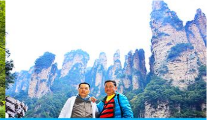
ชมจุดชมวิวลีฟท์แก้ว

วันที่ห้า เมืองจางเจียเจี๋ย - เลือกซื้อโปรแกรมทัวร์เสริมออฟชั่น อุทยานอวดารจุดชมวิวจินเปียนซี- ชมจุดชมวิวลีฟท์แก้ว ร้านหยก- ร้านใบชา – เดินทางกลับเมืองหยีซัง