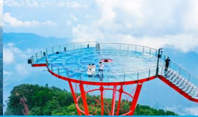
ระเบียงชมวิว Sky Eye