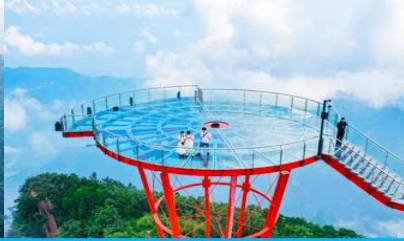
ระเบียงชมวิว Sky Eye