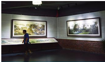
พิพิธภัณฑ์ภาพหินทราย

อัตราค่าบริการสำหรับโปรแกรมเสริมการแสดงชุด The love Story of Wooden man and Fairy Fox ท่านละ 400 หยวน (หรือ 2,000 บาทขึ้นอยู่กับอัตราแลกเปลี่ยน) ระยะเวลาที่ใช้ในการเที่ยวชมการแสดง ประมาณ 3 ชั่วโมง รวมเวลาเดินทางไป กลับค่าบริการรวม ค่าบัตรเข้าชม ค่ารถรับ ส่ง และค่าน้ำดื่มของไกด์ท้องถิ่น พักที่ ZHENMIN HOTEL โรงแรมระดับ 4 ดาวหรือเทียบเท่า