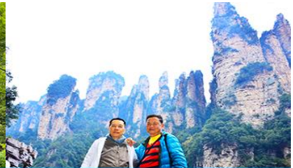
ชมจุดชมวิวลีฟท์แก้ว

วันที่ห้า เมืองจางเจียเจีย -เลือกซื้อโปรแกรมทัวร์เสริมออฟชั่น อุทยานอวตารจุดชมวิวจินเปียนซี-ชมจุดชมวิวลีฟท์แก้ว ร้านหยก- ร้านใบชา – เดินทางกลับเมืองหยีซัง