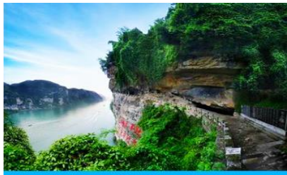
สวนถ้ำสามสหาย