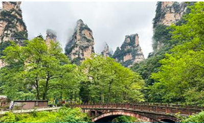
จุดชมวิวจินเปียนซี