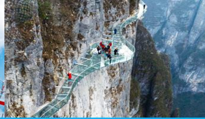
ระเบียงทางเดินเลียบบหน้าผา

วันที่สาม จางเจี๋ยเจี๋ย-ศูนย์สมุนไพรมุ่ยจีน-ผลิตภัณฑ์ยางพารา- กระเช้าขึ้น/ลงเขาเจ็ดดาว – ระเบียงชมวิว Sky Eye - ระเบียงทางเดินเลียบบหน้าผา – (เลือกซื้อโปรแกรมเสริม โชว์จิ้งจอกขาว)