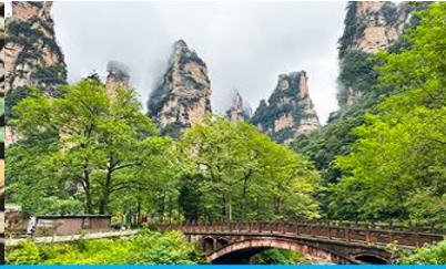
จุดชมวิวจินเปียนซี