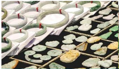
ศูนย์จำหน่ายผลิตภัณฑ์หยก

https://hk.trip.com/hotels/guzhang-hotel-detail-68614854/chaxitai-holiday-hotel/