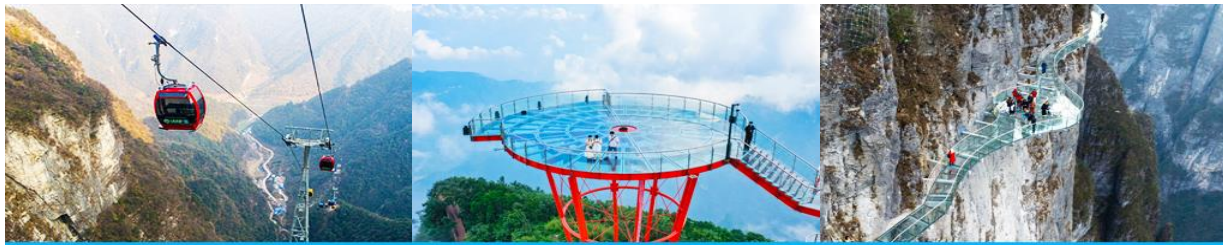
กระเช้าขึ้น/ลงเขาเจ็ดดาว

พักที่ ZHENMIN HOTEL โรงแรมระดับ 4 ดาวหรือเทียบเท่า