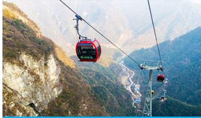
กระเช้าขึ้น/ลงเขาเจ็ดดาว

หลังอาหารนำท่านเดินทางสู่ เมืองจางเจี๋ยเจี๋ย (ระยะทางประมาณ 4 ชั่วโมง) พักที่ ZHENMIN HOTEL โรงแรมระดับ 4 ดาวหรือเทียบเท่า