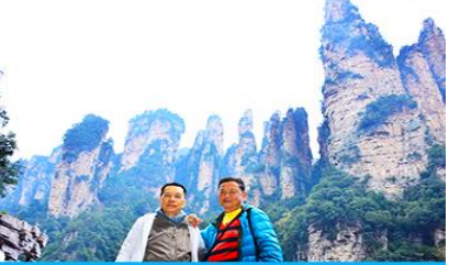
ชมจุดชมวิวลิฟท์แก้ว