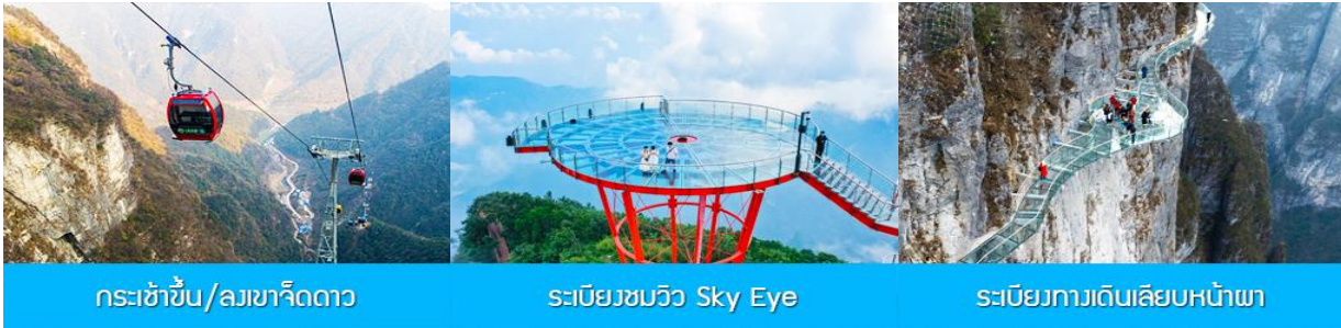
กระเช้าขึ้น/ลงเขาเจ็ดดาว

พักที่ ZHENMIN HOTEL โรงแรมระดับ 4 ดาวหรือเทียบเท่า