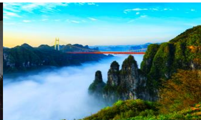
อุทยานป่าไม้แห่งชาติไ่อ้าย