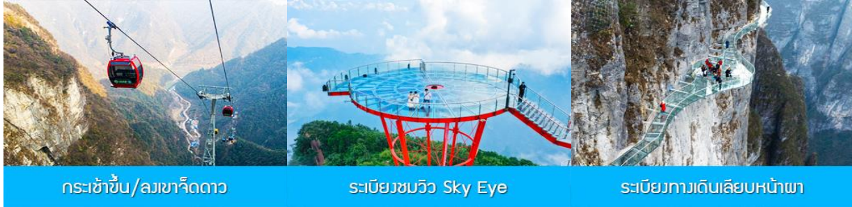
กระเช้าขึ้น/ลงเขาเจ็ดดาว

พักที่ ZHENMIN HOTEL โรงแรมระดับ 4 ดาวหรือเทียบเท่า