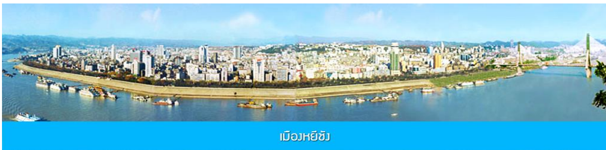
เมืองหยี่ซัง