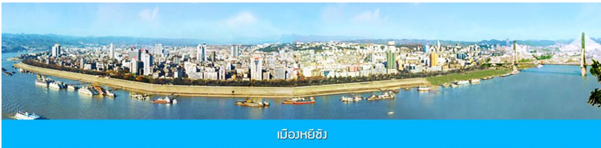
เมืองหยี่ซัง