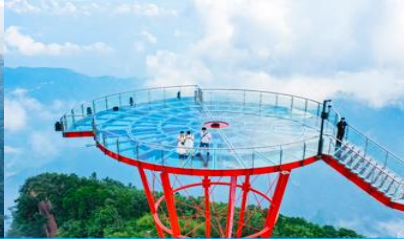
ระเบียงชมวิว Sky Eye