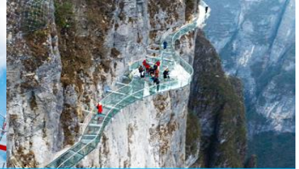
ระเบียงทางเดินเลียบบหน้าผา