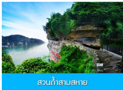
สวนถ้ำสามสหาย