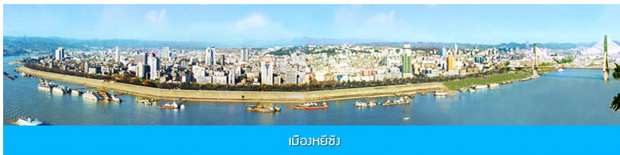
เมืองหยีซัง