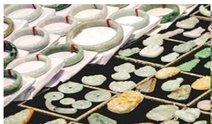
ศูนย์จำหน่ายผลิตภัณฑ์หยก

https://hk.trip.com/hotels/guzhang-hotel-detail-68614854/chaxitai-holiday-hotel/