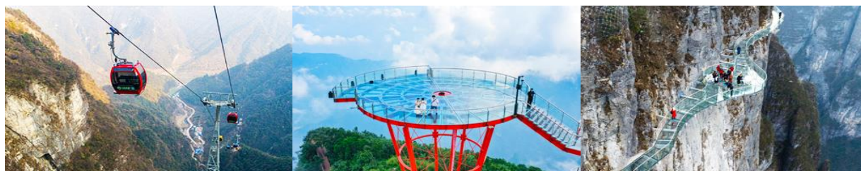
กระเช้าขึ้น/ลงเขาเจ็ดดาว

พักที่ ZHENMIN HOTEL โรงแรมระดับ 4 ดาวหรือเทียบเท่า