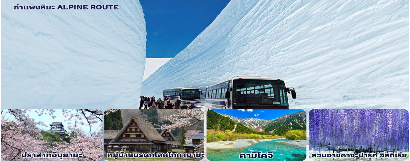
ปราสาทอินูยามะ