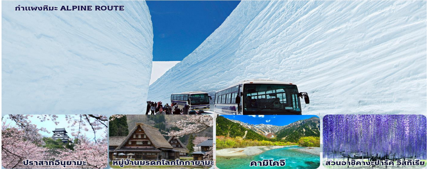
ปราสาทอูนิยามะ