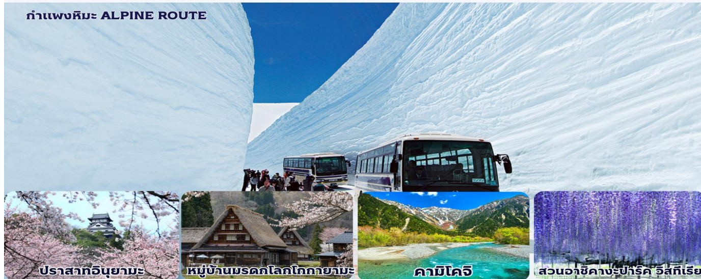
ปราสาทอินุยามะ