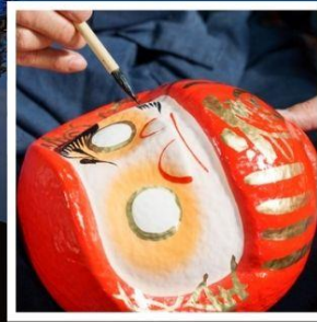
โรงงานตุ๊กตาดารุมะ