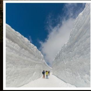
กำแพงหิมะ เจแปนแอลป์