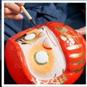
โรงงานตุ๊กตาดารุมะ