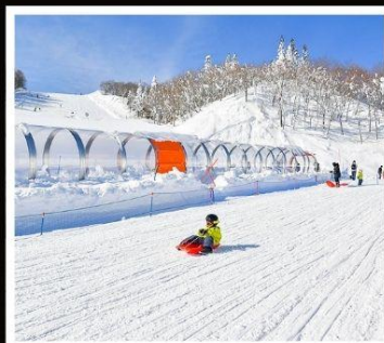
ลานสกี กาล่า ยูซาวะ