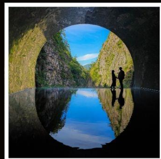
หุบเขาคิโยสึ

เปิดประสบการณ์ใหม่กับฮิปโปบัส ล่องเรือสะเทินน้ำสะเทินบกกลางกรุงโตเกียว!!