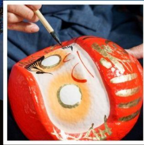
โรงงานตุ๊กตาดารุมะ