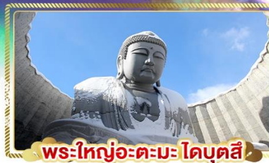
พระใหญ่อะตะมะโตะบุตสึ