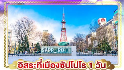
อิสระที่เมืองซัปโปโร 1 วัน