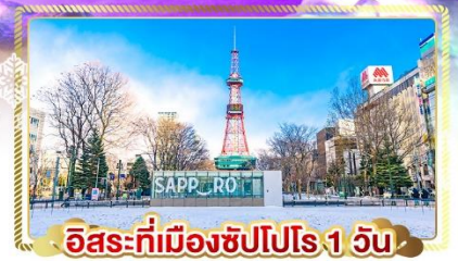
อิสระที่เมืองซัปโปโร 1 วัน