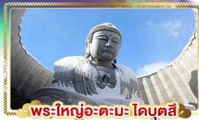
พระใหญ่อะตะมะโอบุตสึ