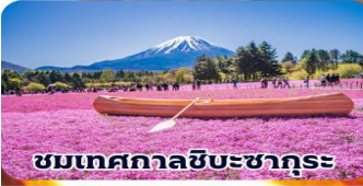
ชมเทศกาลชิบะซากุระ