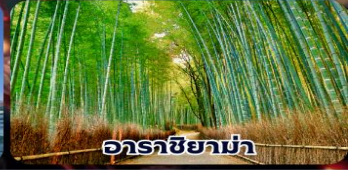
อาราชิยาม่า