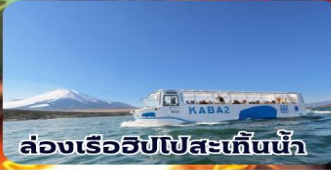
ล่องเรือฮิปโปสะเทินน้ำ