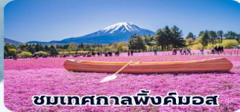
ชมเทศกาลพื้งคิมอส