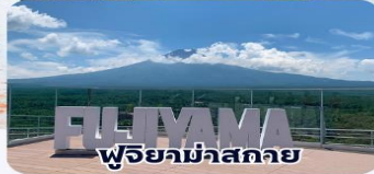
ฟูจยาม่าสกาย