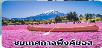
ชมเทศกาลพื้งคิมอส