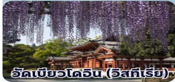
อีดเบียวโดอิน (อัสทีเรีย)