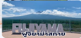
ฟูจิม่าสกาย