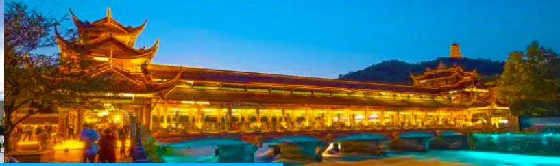
สะพานหนานเจียว