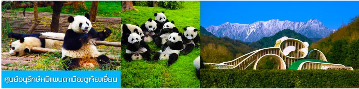
ศูนย์อนุรักษ์หมีแพนดาเมืองตู่เจียงเยี่ยน

ไกด์ท้องถิ่นนำเสนอโปรแกรมทัวร์เสริมบัตรเที่ยวชมศูนย์อนุรักษ์หมีแพนดาเมืองตู่เจียงเยี่ยน และสุกั๊กหม่าล่า สไตล์เสฉวน ..... อัตราค่าบริการท่านละ 300 หยวนหรือ 1,500 บาท ใช้เวลาประมาณ 2 ชั่วโมง (รวมเวลาเดินทางไป กลับ) ค่าบริการรวม ค่าบัตรเข้าอุทยาน ค่ารถรับ ส่ง ค่าอาหารมื้อสุกั๊กหม่าล่า และค่าน้ำดื่มของไกด์ท้องถิ่น