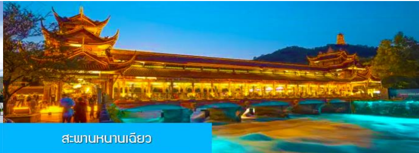
สะพานหนานเจียว

หลังอาหารนำท่านเดินทางสู่ เมืองตูเจียงเยียน 都江堰 (ระยะทาง 234 กม. ใช้เวลาเดินทางราว 4 ชั่วโมง)