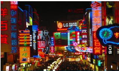
ถนนคนเดินชุนซีลู่