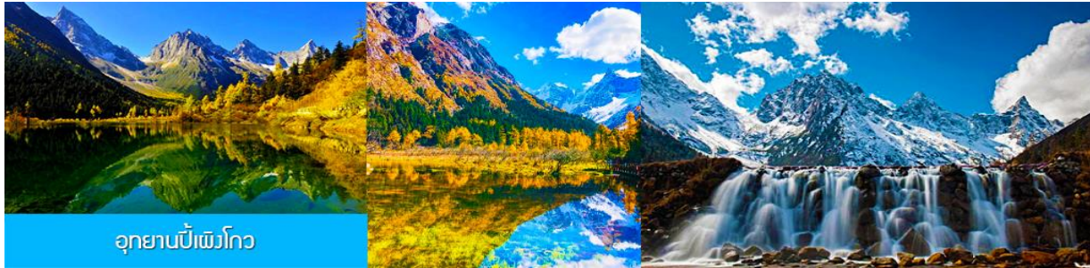
อุทยานปีเพิงโกว

(เนื่องจากถนนสายนี้เป็นถนนสองเลนที่ให้รถวิ่งสวนกันได้ ในช่วงเทศกาลอาจมีการจราจรที่คับคั่ง เนื่องจากมีนักท่องเที่ยวชาวจีนนิยมขับรถผ่านและแวะจอดข้างทางจนทำให้การจราจรติด หรือ ถนนถูกปิดเพราะเกิดจากดินสไลด์จนรถไม่สามารถสัญจรไปมาได้ ทางทัวร์สงวนสิทธิ์ในการปรับเปลี่ยนเส้นทางเดินรถ)