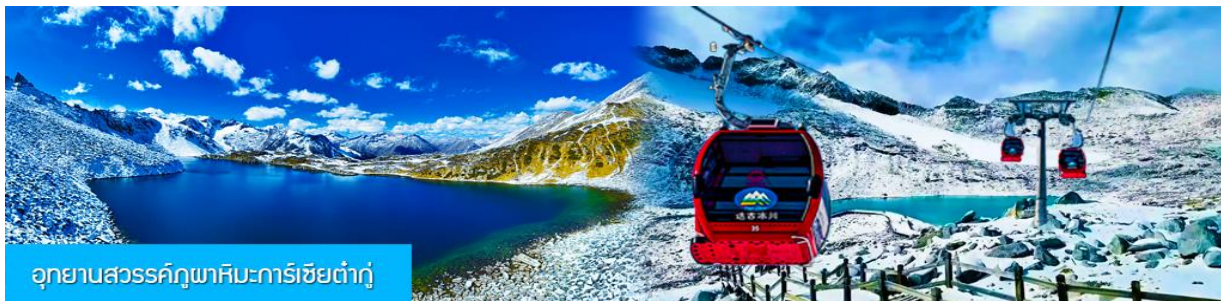
อุทยานสวรรค์ภูเขามะกักริเซียต้ากู่

พักที่ โรงแรม DAGU GLACIER HOTEL ระดับ 4 ดาวห้องดีนหรือเทียบเท่าใกล้อุทยานต้ากู่