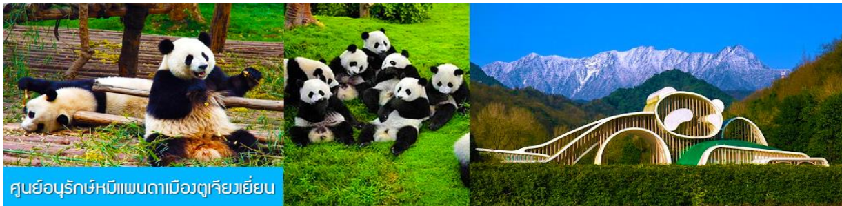
ศูนย์อนุรักษ์หมีแพนด้าเมืองตู่เจียงเยี่ยน