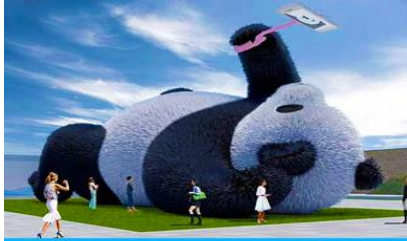
ตุ๊กตาแพนด้าอนเซลฟี