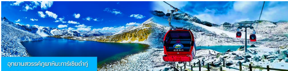
อุทยานสวรรค์ภูผาหิมะการ์เซียต้าถู่

พักที่ โรงแรม DAGU GLACIER HOTEL ระดับ 4 ดาวท้องถิ่นหรือเทียบเท่าใกล้อุทยานต้าถู่