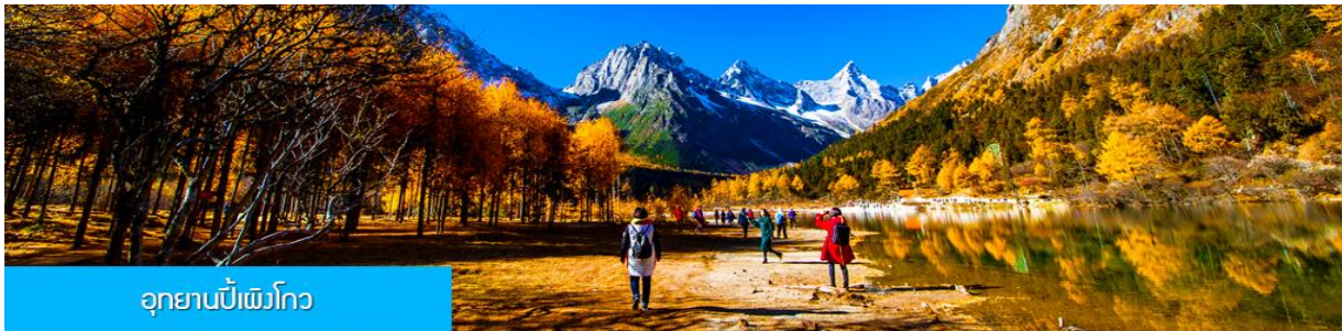
อุทยานปีผิงโกว

พักที่ โรงแรม NEWSIGUNIANG SHAN HOTEL ระดับ 4 ดาวท้องถิ่นหรือเทียบเท่าใกล้เขตอุทยาน