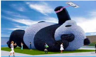
ตุ๊กตาแพนด้าขนาดยักษ์