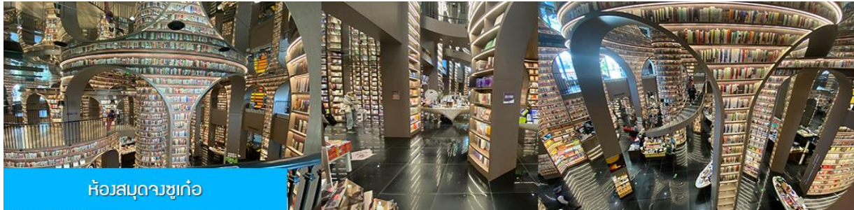
ห้องสมุดจวงซูเก้อ

พักที่ โรงแรม CENTER INTER HOTEL ระดับ 4 ดาวห้องดีนหรือเทียบเท่าในเมืองตู่เจียงเยี่ยน