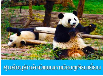
ศูนย์อนุรักษ์หมีแพนด้าเมืองตู่เจียงเยี่ยน