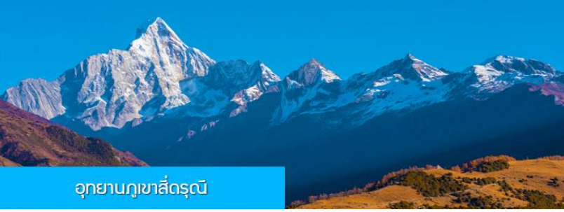
อุทยานภูเขาสีครุณี