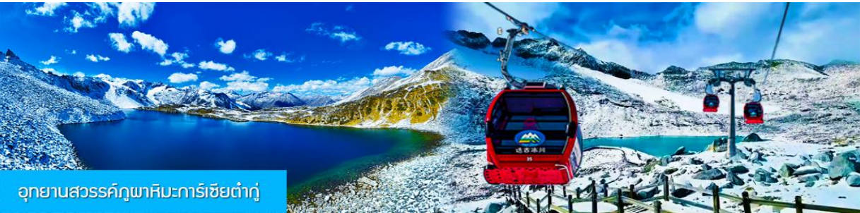
อุทยานสวรรค์ภูผาหิมะการ์เซียต้าถู่

พักที่ โรงแรม DAGU GLACIER HOTEL ระดับ 4 ดาวห้องดีนหรือเทียบเท่าใกล้อุทยานต้าถู่