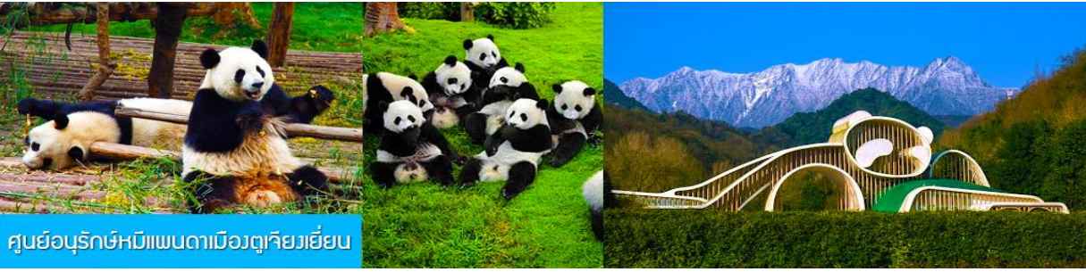
ศูนย์อนุรักษ์หมีแพนดาเมืองตู่เจียงเยียน

ไกด์ท้องถิ่นนำเสนอโปรแกรมทัวร์เสริมบัตรเที่ยวชมศูนย์อนุรักษ์หมีแพนดาเมืองตู่เจียงเยียน และสุกั๊กหม่าล่า สไตล์เสฉวน ..... อัตราค่าบริการท่านละ 300 หยวนหรือ 1,500 บาท ใช้เวลาประมาณ 2 ชั่วโมง (รวมเวลาเดินทางไป กลับ) ค่าบริการรวม ค่าบัตรเข้าอุทยาน ค่ารถรับ ส่ง ค่าอาหารมื้อสุกั๊กหม่าล่า และค่าน้ำดื่มของไกด์ท้องถิ่น