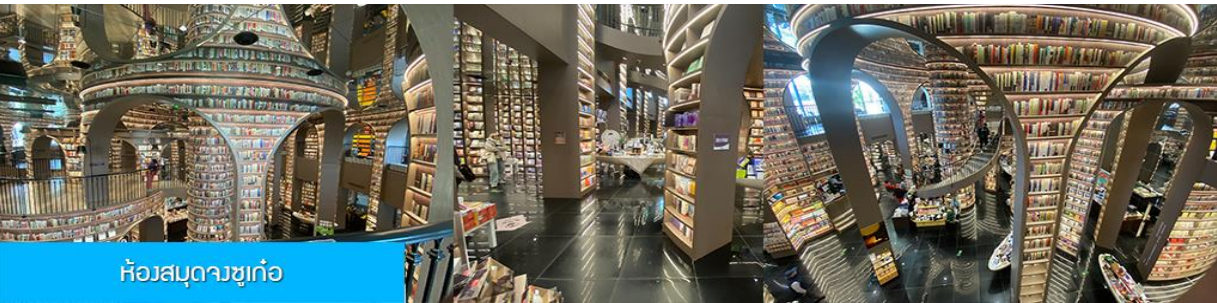
ห้องสมุดจวงชู่เก๋อ

หลังอาหารนำท่านชม สะพานหนานเจียว 南桥 สะพานโบราณพร้อมแม่น้ำตูเจียงเยียนขึ้นชื่อที่ได้กลายเป็นแหล่งท่องเที่ยวสำคัญและจุดเช็คอินสำหรับนักท่องเที่ยว ในช่วงค่ำที่นี่จะประดับประดาด้วยแสงสี บริเวณริมแม่น้ำจะถูกประดับด้วยแสงไฟสีฟ้าที่ทอดยาวไปตามแนวแม่น้ำ ชาวบ้านตั้งชื่อว่าเป็น น้ำตาสีฟ้า 蓝色眼泪 พักที่ โรงแรม CENTER INTER HOTEL ระดับ 4 ดาวท้องถิ่นหรือเทียบเท่าในเมืองตูเจียงเยียน