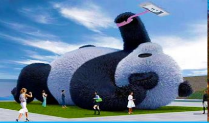
ตุ๊กตาแพนด้าอนเซลฟี