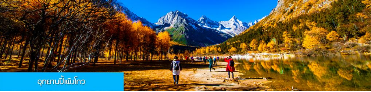
อุทยานปีนังโกว