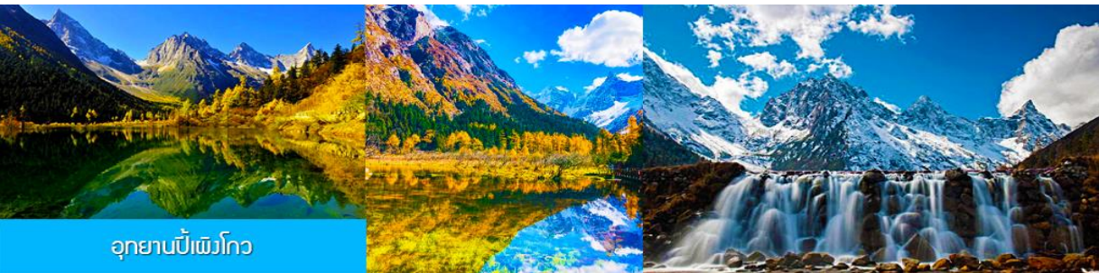
อุทยานปีนังโกว

หลังอาหารเช้าท่านเดินทางสู่ อุทยานปีนังโกว 毕鹏沟景区 (ระยะทาง 300 กม. ใช้เวลาเดินทางราว 4 ชั่วโมงครึ่ง) โดยรถจะ วิ่งผ่าน ถนนสาย หลี่เซียงลู่ 理小路 ที่ได้ชื่อว่าเป็นถนนที่มีวิวทิวทัศน์สวยงามที่สุดเส้นหนึ่งของจีน และเป็นเส้นทางผ่านชมวิวที่สวยงามที่สุดของมณฑลเสฉวน ระหว่างทางท่านจะได้สัมผัสกับทิวทัศน์ที่สวยงามราวภาพเขียน ที่มีลักษณะภูมิประเทศที่สลับซับซ้อน ประกอบด้วย ภูเขาหิมะสูง หุบเขาหวลิกที่มีสายน้ำไหลผ่าน ในฤดูหนาวท่านจะได้พบกับภูเขาและป่าไม้ที่ปกคลุมโดยหิมะขาวโพลน ในฤดูใบไม้ผลิและฤดูร้อนที่นี่จะเขียวชอุ่มด้วยผืนป่า และในฤดูใบไม้ร่วงท่านจะได้สัมผัสความสวยงามของใบไม้เปลี่ยนสีอันสวยงาม (เนื่องจากถนนสายนี้เป็นถนนสองเลนที่ให้รถวิ่งสวนได้ ในช่วงเทศกาลอาจมีการจราจรที่คับคั่ง เนื่องจากมีนักท่องเที่ยวชาวจีนนิยมขับรถผ่านและแวะจอดข้างทางจนทำให้การจราจรติด หรือ ถนนถูกปิดเพราะเกิดจากดินสไลด์จนรถไม่สามารถสัญจรไปมาได้ ทางทัวร์สงวนสิทธิ์ในการปรับเปลี่ยนเส้นทางเดินทาง)