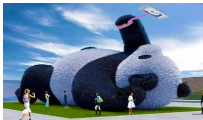
ตุ๊กตาแพนด้าบนเซลฟี

ระหว่างเดินทางท่านสามารถชมทัศนียภาพธรรมชาติอันงดงามของสองข้างถนนขณะที่รถแล่นผ่าน ที่มีทั้งภูเขาหิมะสูง หุบเขา ธารน้ำ และทุ่งหญ้าบนที่ราบสูง หรือพักผ่อนตามอัชฌาศัยบนรถระหว่างเดินทาง