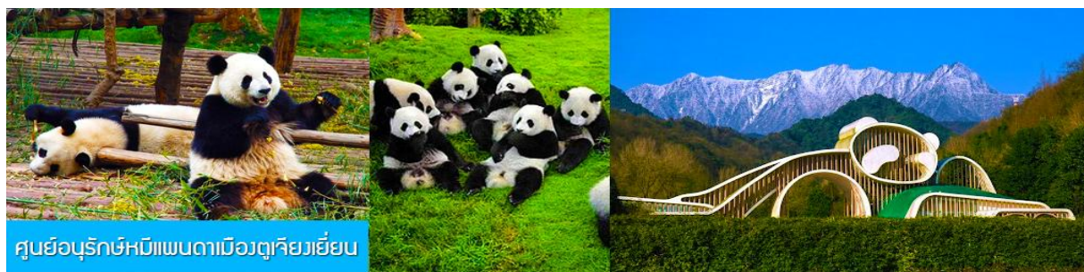
ศูนย์อนุรักษ์หมีแพนด้าเมืองตู่เจียงเยี่ยน