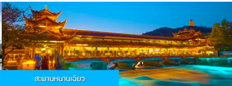
สะพานหนานเจียว