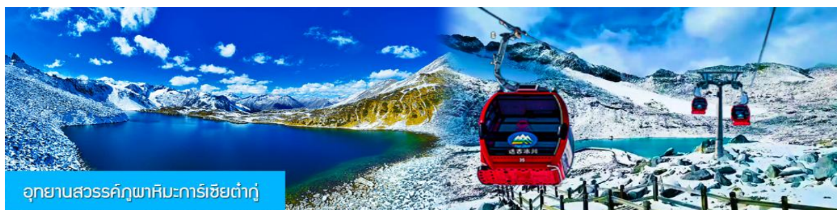
อุทยานสวรรค์ภูผาหิมะการ์ชียต้าถู่

พักที่ โรงแรม DAGU GLACIER HOTEL ระดับ 4 ดาวท้องถิ่นหรือเทียบเท่าใกล้อุทยานต้าถู่