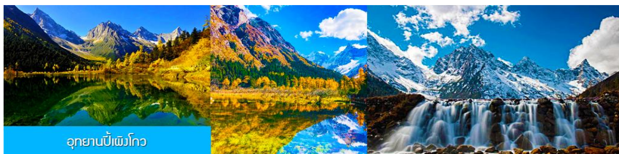
อุทยานปีศาจโกว