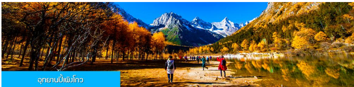
อุทยานปีเฉิงโกว