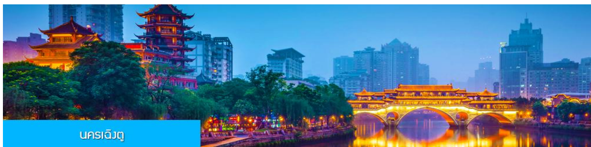
นครเฉิงตู