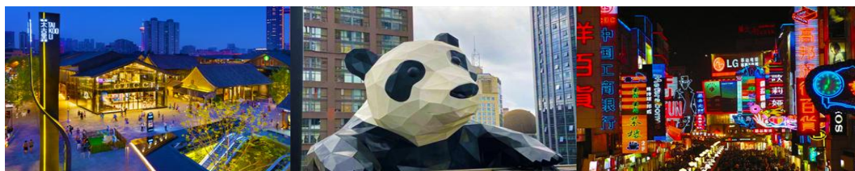
ถนนไท่กุ่หลี่ และวัดต้าเจี๊ว