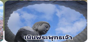
เป็นพระพุทธรเจ้า

THAI สายการบินไทย บริการทุกระดับประทับใจ FULL SERVICE