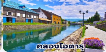
คลองโอดารุ