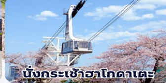
นั่งกระเช้าฮาโกดาเตะ