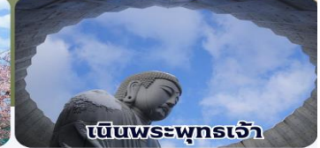
เป็นพระพุทธรเจ้า

THAI สายการบินไทย บริการทุกระดับประทับใจ FULL SERVICE