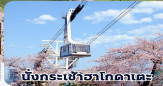
นั่งกระเช้าฮาโกดาเตะ