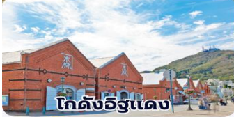
โกดังอิฐแดง