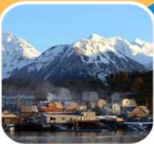
ล่องเรือดูปลาวาฬ เมือง SITKA

รวมทัวร์ล่องเรือชมปลาวาฬ * รวมทัวร์รถไฟโวกท์พาส * รวมค่าวีซ่าแคนาดา รวมเที่ยวชายฝั่ง แวนคูเวอร์* จูโน * สแก็กเวย์ * ธารน้ำแข็ง inside passage * ซิตกา Royal Caribbean Cruise Line ตระกูลเรือสำราญที่ดีที่สุดในการล่องอลาสกา