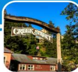
เมืองท่าหน้าเดิน เมือง Ketchikan