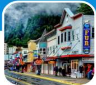
เมืองท่าเล็ก ๆ น่าเที่ยว เมือง Juneau

บินไปนอนก่อน 2 คืน ก่อนลงเรือ เที่ยวแวนคูเวอร์ รวมค่าวีซ่า ซอปิ้งจูงใจ บิน สายการบิน แอร์ไชน่า