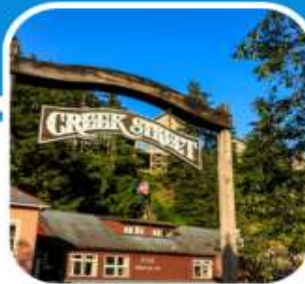
เมืองท่าหน้าเดิน เมือง Ketchikan