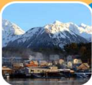
ล่องเรือดูปลาวาฬ เมือง SITKA

รวมทัวร์ล่องเรือชมปลาวาฬ * รวมทัวร์รถไฟโวกท์พาส * รวมค่าวีซ่าแคนาดา รวมเที่ยวชายฝั่ง แวนคูเวอร์* จูโน * สแก็กเวย์ * ธารน้ำแข็ง inside passage * ซิตกา Royal Caribbean Cruise Line ตระกูลเรือสำราญที่ดีที่สุดในการล่องอลาสกา