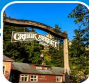
เมืองท่าหน้าเดิน เมือง Ketchikan