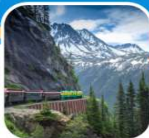
นั่งรถไฟโวกท์พาส เมือง Skagway