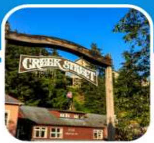
เมืองท่าหน้าเดิน เมือง Ketchikan