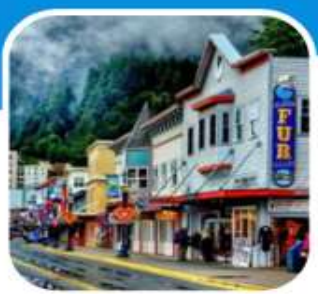
เมืองท่าเล็ก ๆ น่าเที่ยว เมือง Juneau

บินไปนอนก่อน 2 คืน ก่อนลงเรือ เที่ยวแวนคูเวอร์ รวมค่าวีซ่า ซอปิ้งจูงใจ บิน สายการบิน แอร์ไชน่า