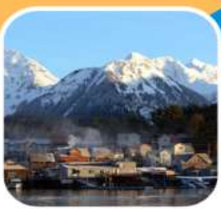
ล่องเรือดูปลาวาฬ เมือง SITKA

รวมทัวร์ล่องเรือชมปลาวาฬ * รวมทัวร์รถไฟไวท์พาส * รวมค่าวีซ่าแคนาดา รวมเที่ยวชายฝั่ง แวนคูเวอร์* จูโน * สแก็กเวย์ * ธารน้ำแข็ง inside passage * ซิตกา Royal Caribbean Cruise Line ตระกูลเรือสำราญที่ดีที่สุดในการล่องอลาสกา