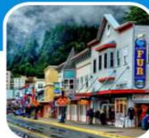
เมืองท่าเล็ก ๆ น่าเที่ยว เมือง Juneau

บินไปนอนก่อน 2 คืน ก่อนลงเรือ เที่ยวแวนคูเวอร์ รวมค่าวีซ่า ซอปปิ้งจุใจ บิน สายการบิน แอร์ไชน่า