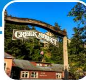
เมืองท่าหน้าเดิน เมือง Ketchikan