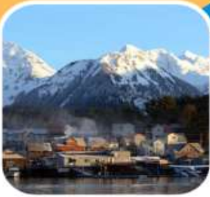
ล่องเรือดูปลาวาฬ เมือง SITKA

รวมทัวร์ล่องเรือชมปลาวาฬ * รวมทัวร์รถไฟโวกท์พาส * รวมค่าวีซ่าแคนาดา รวมเที่ยวชายฝั่ง แวนคูเวอร์* จูโน * สแก็กเวย์ * ธารน้ำแข็ง inside passage * ชิตก้า Royal Caribbean Cruise Line ตระกูลเรือสำราญที่ดีที่สุดในการล่องอลาสก้า