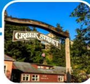
เมืองท่าหน้าเดิน เมือง Ketchikan