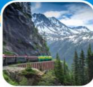
นั่งรถไฟโวกท์พาส เมือง Skagway