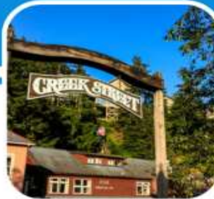
เมืองท่าหน้าเดิน เมือง Ketchikan