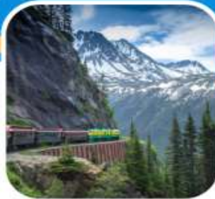
นั่งรถไฟไวท์พาส เมือง Skagway