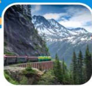
นั่งรถไฟโวกท์พาส เมือง Skagway