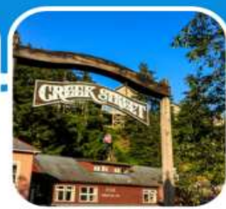
เมืองท่าหน้าเดิน เมือง Ketchikan