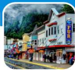
เมืองท่าเล็ก ๆ น่าเที่ยว เมือง Juneau

บินไปนอนก่อน 2 คืน ก่อนลงเรือ เที่ยวแวนคูเวอร์ รวมค่าวีซ่า ซอปปิ้งจูงใจ บิน สายการบิน แอร์ไชน่า